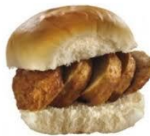
Een lekker broodje bal

In onze kantine, waar ook uw hond welkom is, kunt u de inwendige mens verwennen met een hapje en een drankje. Specialiteit van de dag is dit keer, vers uit eigen keuken: